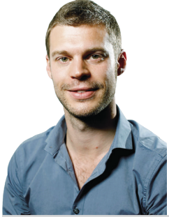
Bjørnar Moxnes b.moxnes@roedt.no Leder i Rødt