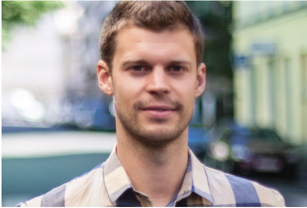
Rødt-leder: Bjørnar Moxnes.