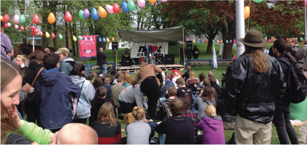
Trondheim mot rasisme: Folkefest i Lamoparken i mai i år.