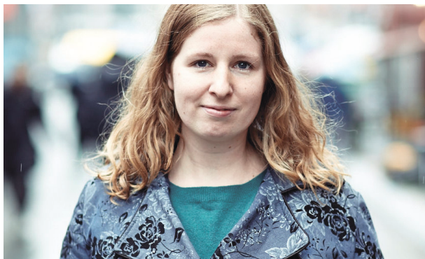
Miljøpolitisk talsperson: Elin Volder Rutle.