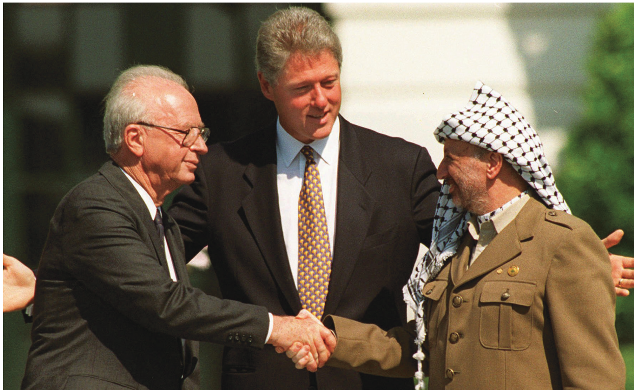
Oslo-avtalen: Yitzhak Rabin, Bill Clinton og Yasser Arafat i 1993.